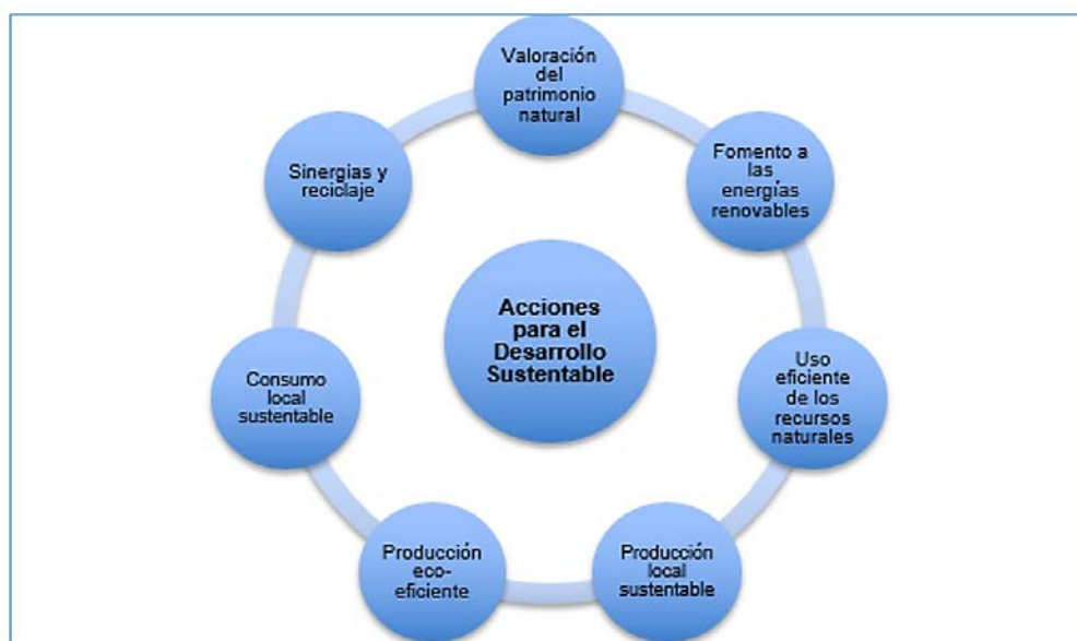
Diagrama 2. Acciones del desarrollo sustentable

su capital natural como en el caso de áreas forestales, recursos minerales, remediación de suelos, limpieza de cuerpos de agua; el impulso a proyectos de energías renovables a escala pequeña mediante el aprovechamiento de residuos orgánicos, el uso de biocombustibles, la instalación de aerogeneradores a escala doméstica o el uso de fotoceldas; la optimización en el uso del agua o de los suelos fértiles; la producción agroecológica basada en insumos orgánicos y la crianza de animales sin alimentos balanceados ni hormonas; el fomento al consumo de productos locales y el reciclaje de subproductos del proceso productivo o del uso doméstico. Todo este tipo de acciones se están impulsando como alternativas sustentables en localidades que empiezan a consolidar el trabajo colectivo y han visto repercusiones positivas sobre los socios y sobre el resto de la comunidad.